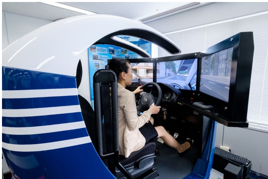
同社のショールームには、さまざまな VR ソリューションの展示を行っている。これは車の運転を仮想的に体験できるドライビングシミュレータ

この車の運転などを仮想的に体験できるドライビングシミュレータもそのひとつだ。ネットワークを介して複数のコンピュータを結合したクラスターシステムを構成し、複数の表示装置に対してそれぞれ対応するコンピュータで生成した各映像を、低遅延で同期表示するシミュレーションシステムを提供している。これらの高度な技術開発においても Delphi を活用することで、迅速に開発ができていくという。